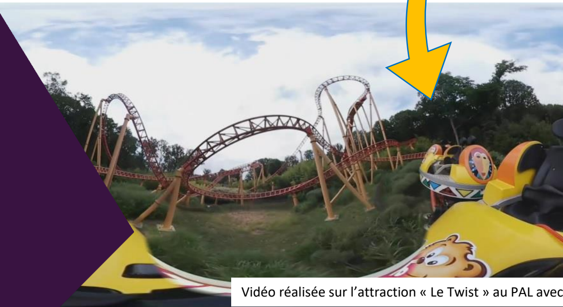
Vidéo réalisée sur l'attraction « Le Twist » au PAL avec notre tout premier modèle de caméra 360° en 2017.