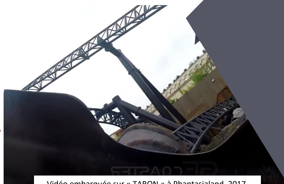
Vidéo embarquée sur « TARON » à Phantasialand, 2017.