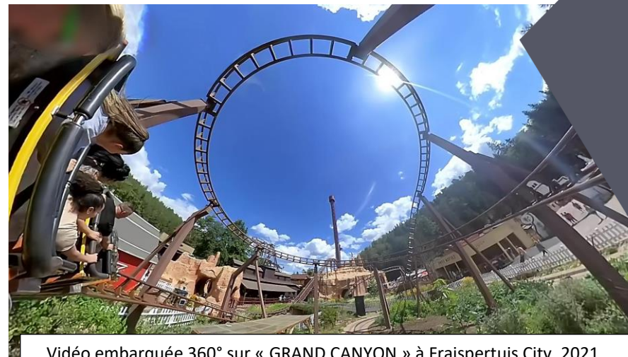
Vidéo embarquée 360° sur « GRAND CANYON » à Fraispertuis City, 2021.