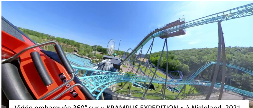
Vidéo embarquée 360° sur « KRAMPUS EXPEDITION » à Nigloland, 2021.

1 captation pour GFcoaster, Uride360 et votre entreprise en même temps ! Après le tournage, vous aurez accès aux images, gratuitement , grâce aux systèmes de partage que proposent les sites internet MEGA.NZ ou via WeTransfer.com.