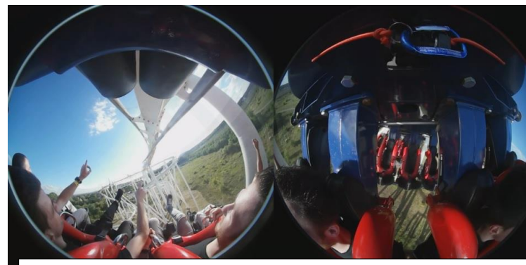
MONSTER Walygator GE – 360° GFcoaster, ancienne caméra, 2017.